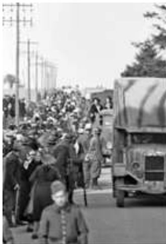
2. Colonne de réfugiés Juin 1940