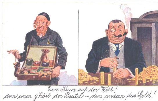
1. « Le Juif riche » Un fardeau pour le monde ! La bourse appartient à l'un et la fortune à l'autre Carte postale, 1900 Extraite de l'ouvrage de Gérard Sylvain et Joël Kotek, La carte postale antisémite, de l'affaire Dreyfus à la Shoah , Berg International, 2005