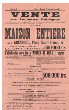
7. Affiche de vente d'un immeuble 4, place Saint-Bruno, 30 juin 1944