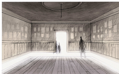
8. Exposition Spoliés ! « La maison suspendue » Dessin de travail d'Ignasi Cristia Février 2010