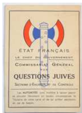
4. Carte d'identité d'un agent du Commissariat général aux Questions juives